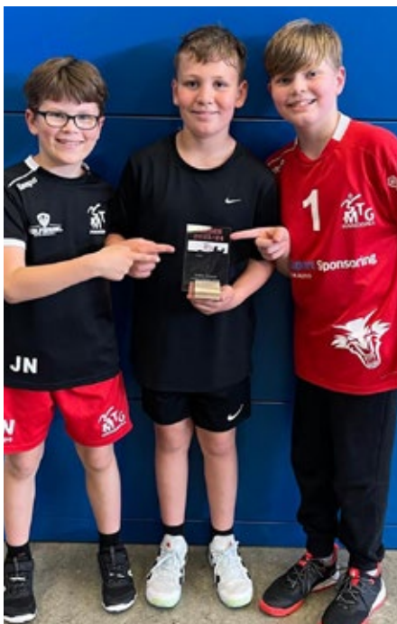
Drei unserer E-Jugendlichen mit dem von der Firma druckdeinglas.de zum Saisonabschluss gespendeten Akrylpokal.